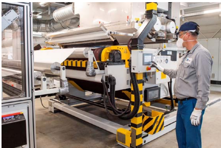
Foto: Dutch PPE Solutions produceert meltblown filter material in Nederland en gebruikt daarvoor Borealis Borneables™ polypropylene (PP)